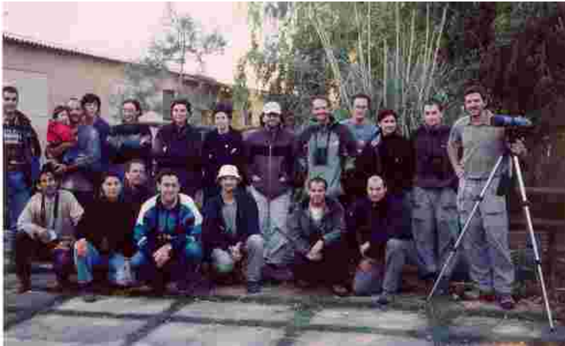
Fotografia de grup de part dels ornitòlegs participants, un cop finalitzada la maratò ornitològica, al Corral del Valls de Bellvís. Va ser tot un èxit de participació.