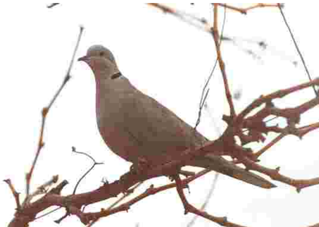
La tòrtora turca ( Streptopelia decaocto ), actualment tan freqüent als jardins dels nostres pobles, va ser una de les espècies més observades per tots els grups.