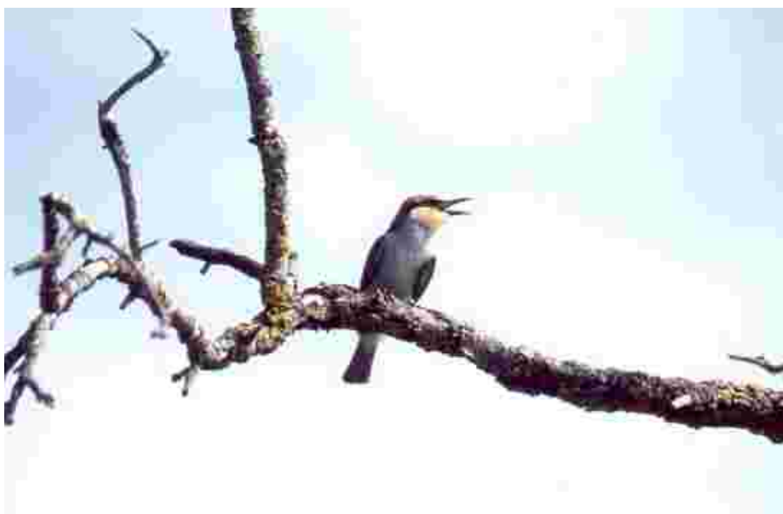
El multicolor abellerol ( Merops apiaster ), també anomenat “canadenc” o “bellerol”, alegra el nostre cel amb les seves cabrioles aèries, tot caçant insectes grossos.