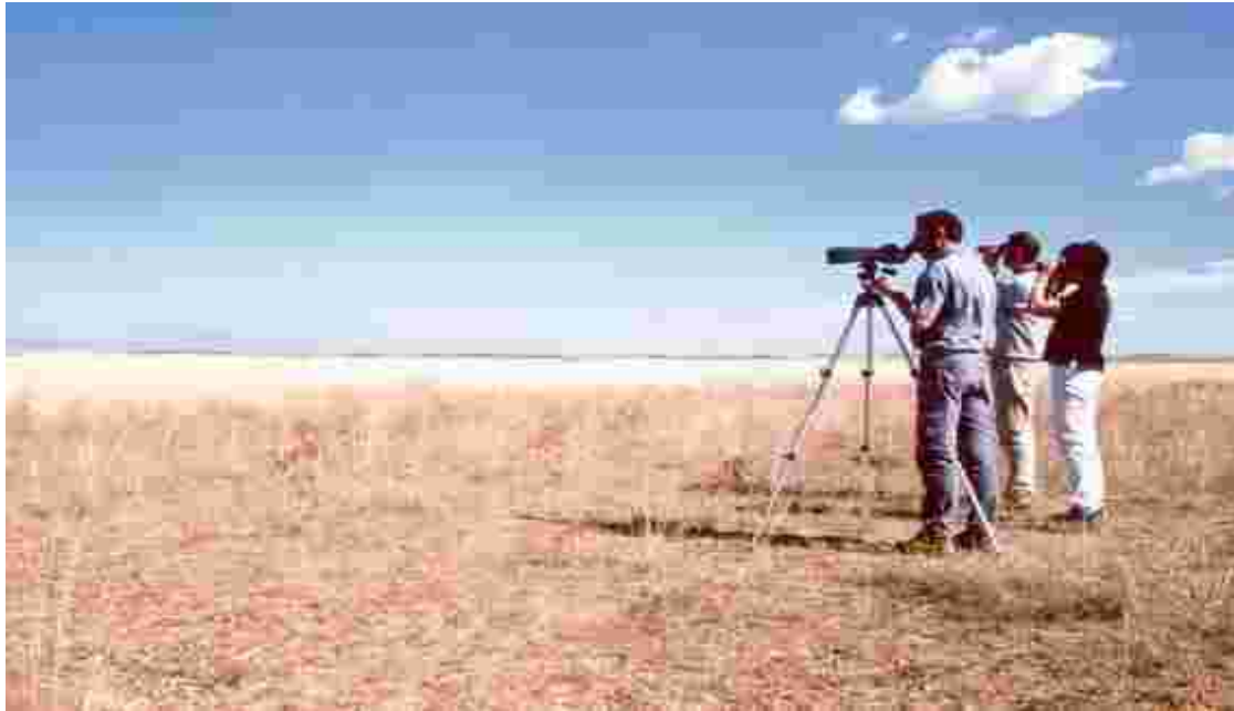
La Timoneda d'Alfés ha estat una de les àrees més visitades, ja que és l'únic lloc de Catalunya on trobem a l'alosa becuda o de Dupond ( Chersophilus duponti ).